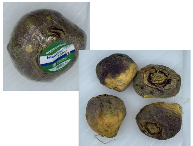
Myndirnar sýna pakkaðar og ópakkaðar gulrófur eftir 10 vikur í geymsluþolstilraun.