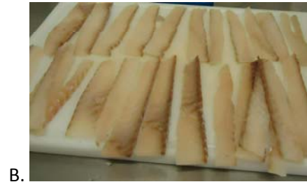
Mynd A. Fyrstu skurðarprófanir B. Lokaafurð skurðarprófana

Við innleiðingu á þessum skurðarvélbúnaði varð varan mun staðlaðri, minni rýrnun, auk þess sem gífurlegur vinnusparnaður varð af þessari þróun.