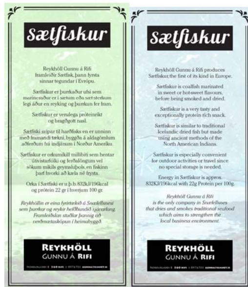
Mynd G. Kynningarefni til notkunar á sölustöðum